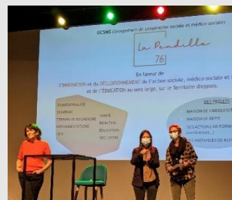
La Pendille76 a organisé une conférence « les mots qui font grandir » en novembre 2021

Elle construit le projet d'une Maison de Répit pour le territoire et pourra porter des projets transversaux aux différents secteurs.