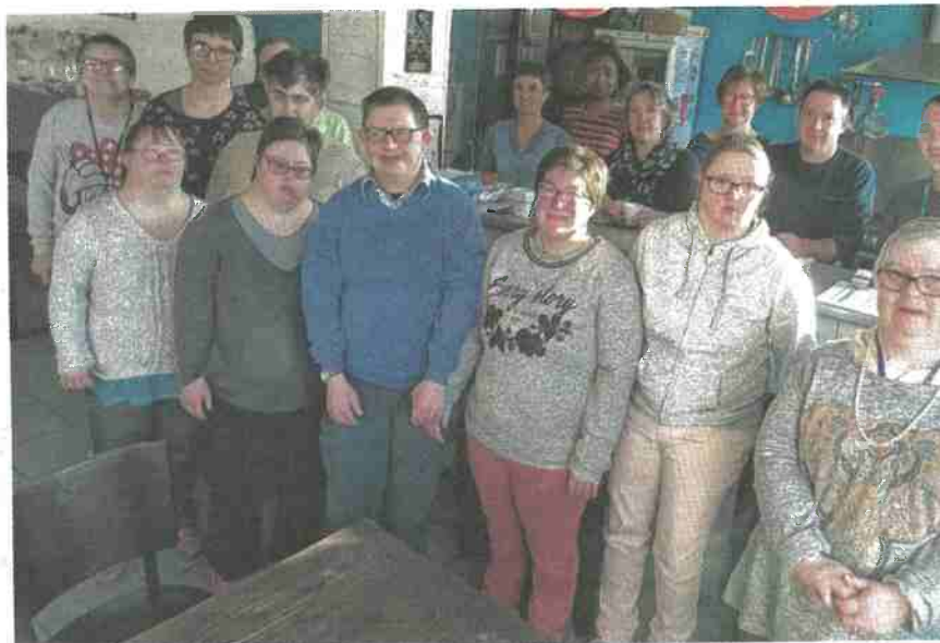
Une partie des participants et des éducateurs de l'Atelier du Ravelin se préparent à fêter 30 ans de la structure.

Et le public de son côté a été invité à passer le pas de la porte de l'Atelier du Ravelin depuis l'ouverture en 2005 de l'Art café, un lieu qui propose une