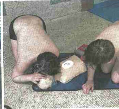
Ce ne sont pas moins de 72 collégiens neuvillais qui suivent ces séances de secourisme