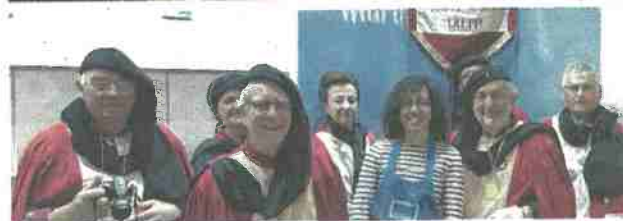
La région dieppoise a été représentée par un taureau et la Confrérie du hareng et de la coquille Saint-Jacques, la semaine dernière, au Salon de l'agriculture.